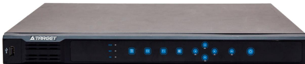
TNR-2416 PE TNR-2432 PE