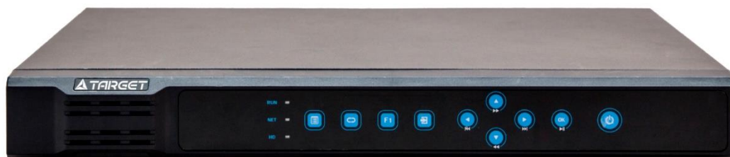
TSNR-228 HP TSNR-2216 HP